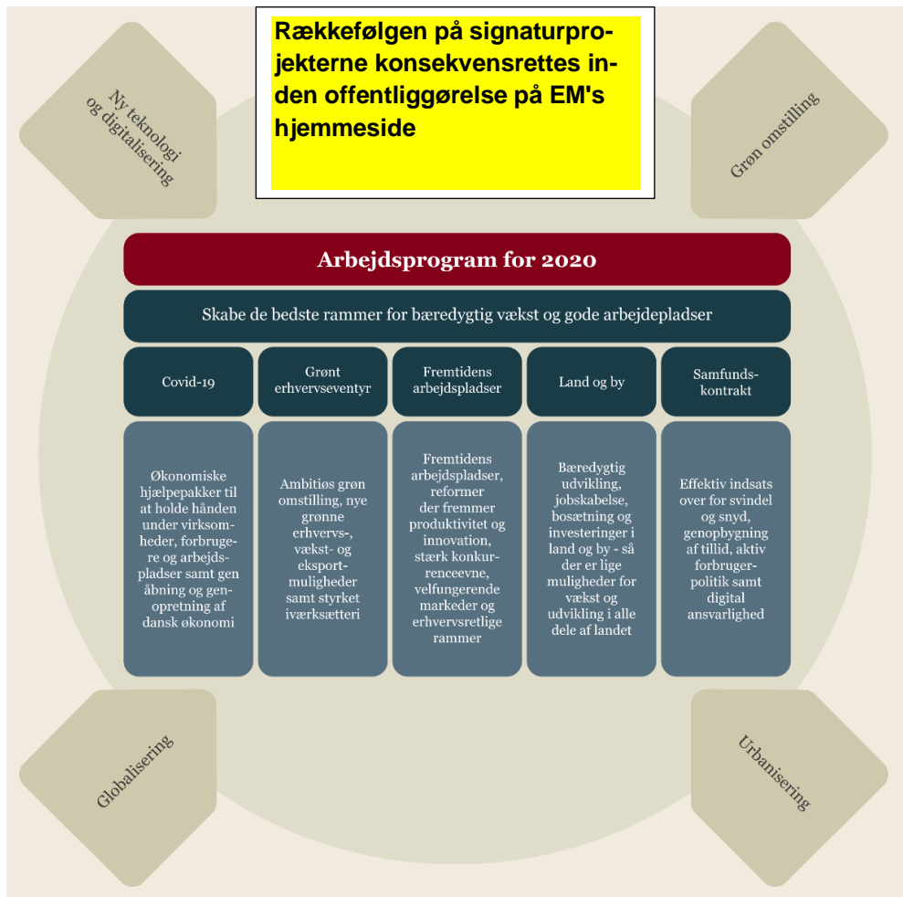
Figur 1. Ministeriets arbejdsprogram for 2020 og udviklinger frem mod 2025

Nedenstående figur skitserer sammenhængen mellem udviklingstendenserne frem mod 2025, og hvordan Erhvervsministeriet vil håndtere disse tendenser i 2020 gennem arbejdsprogrammets overordnede indsatsområder, der indeholder en række konkrete mål, der fremgår af de efterfølgende kapitler.